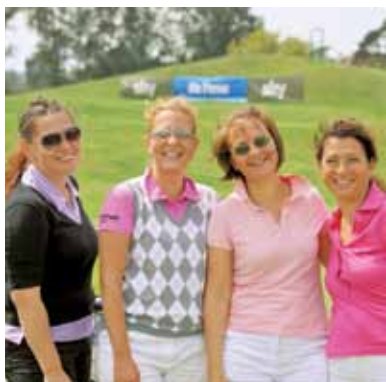
Tolle Stimmung un Höhenflüge.